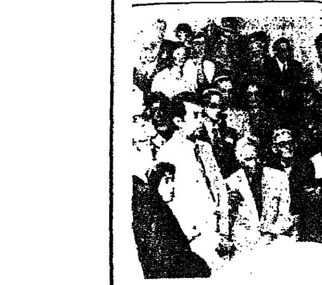
رئيس الدولة السيد اسحق رافون يلقي كلمة في اثناء زيارته للكنيس اليهودي في شارع عدلي بيشا في القاهرة.